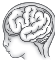
39 a 40 semanas